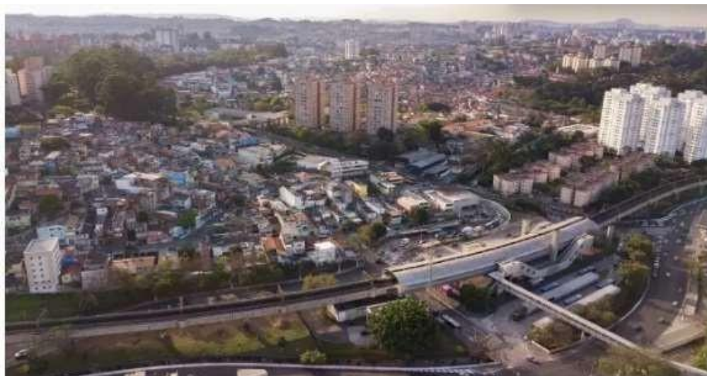
Vista aérea do bairro do Campo Limpo, na Zona Sul