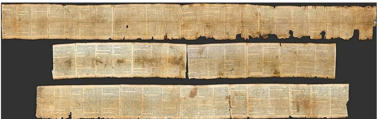
Imagem 4 - O Grande Pergaminho de Isaías (1QIsaa), um dos sete originais do Mar Morto descobertos em Qumran em 1947.