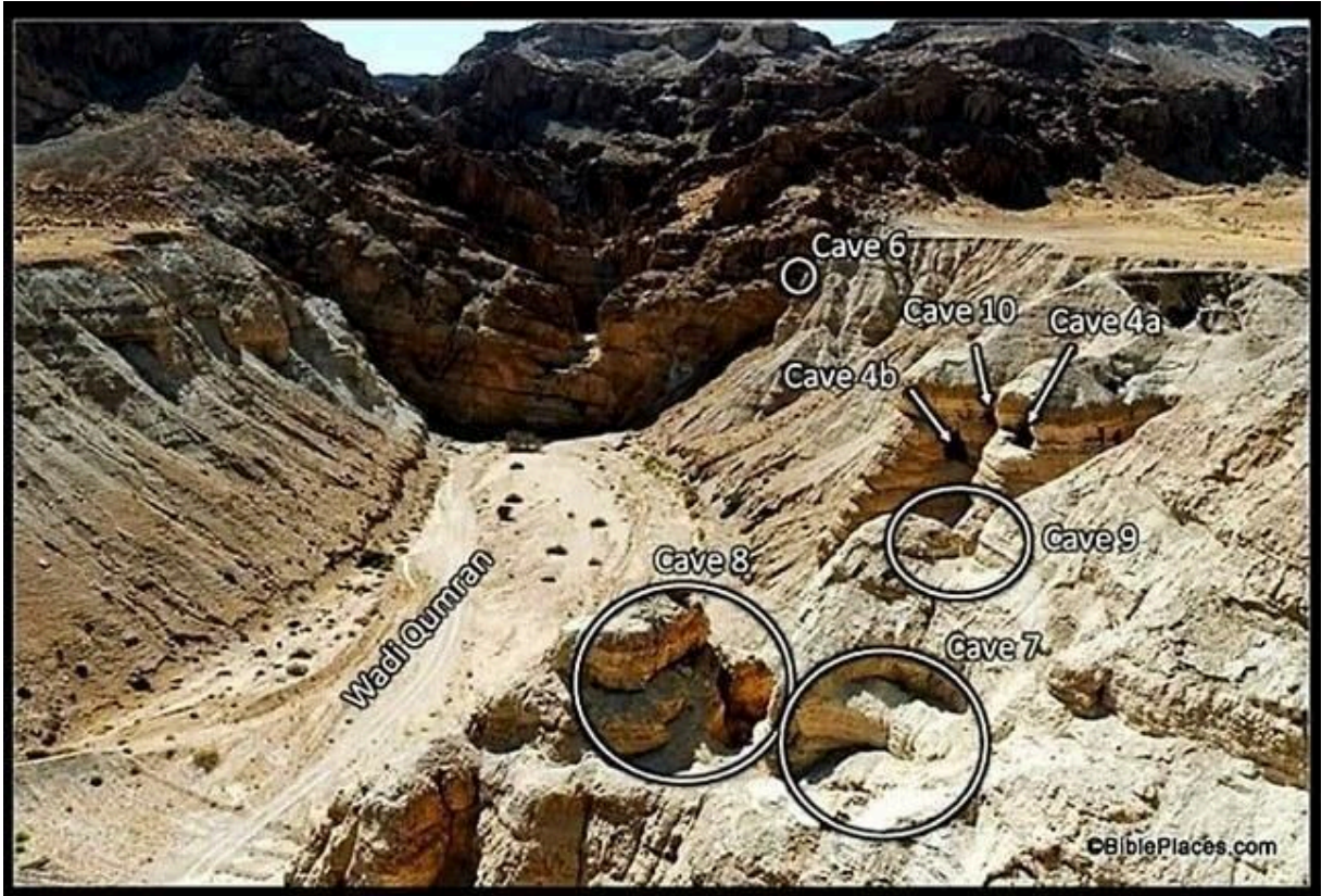
Imagem 3 - Localização das 11 cavernas em Qumran onde foram encontrados os pergaminhos do Mar Morto