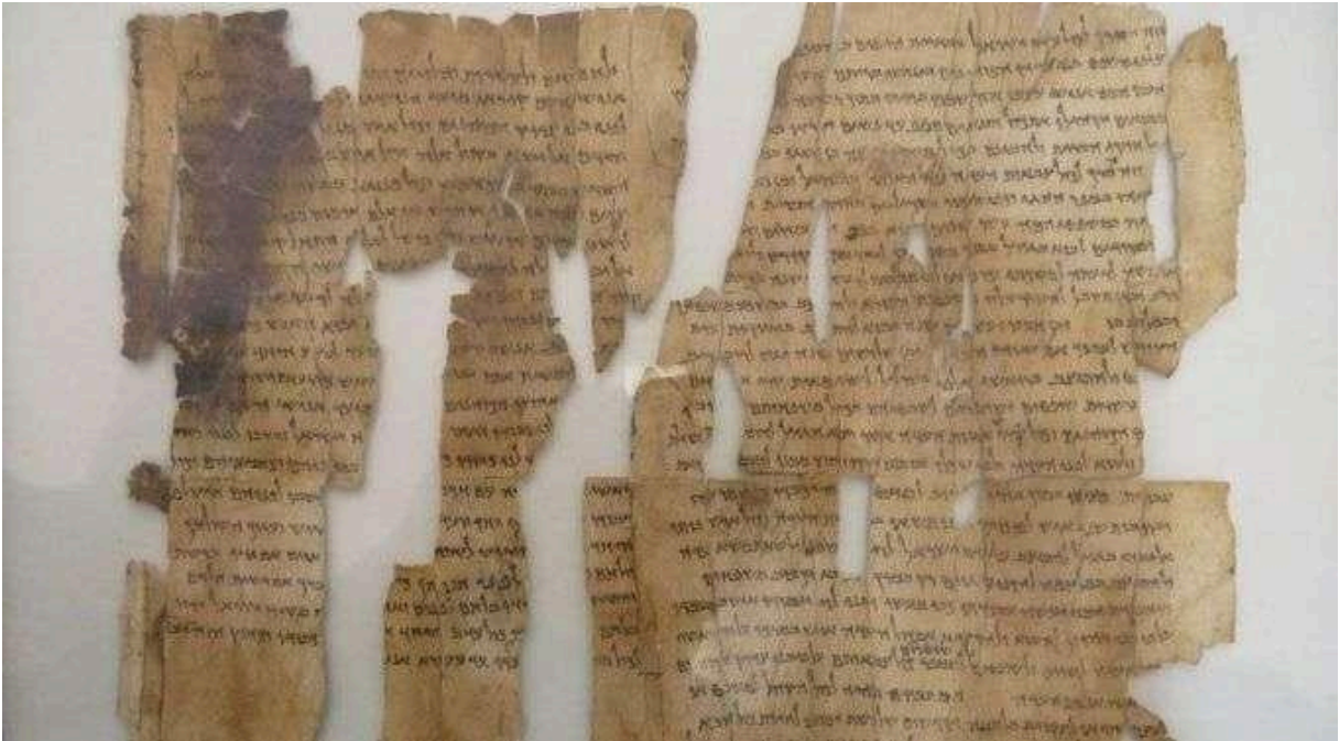
Imagem 1- Manuscritos do Mar Morto (1947)