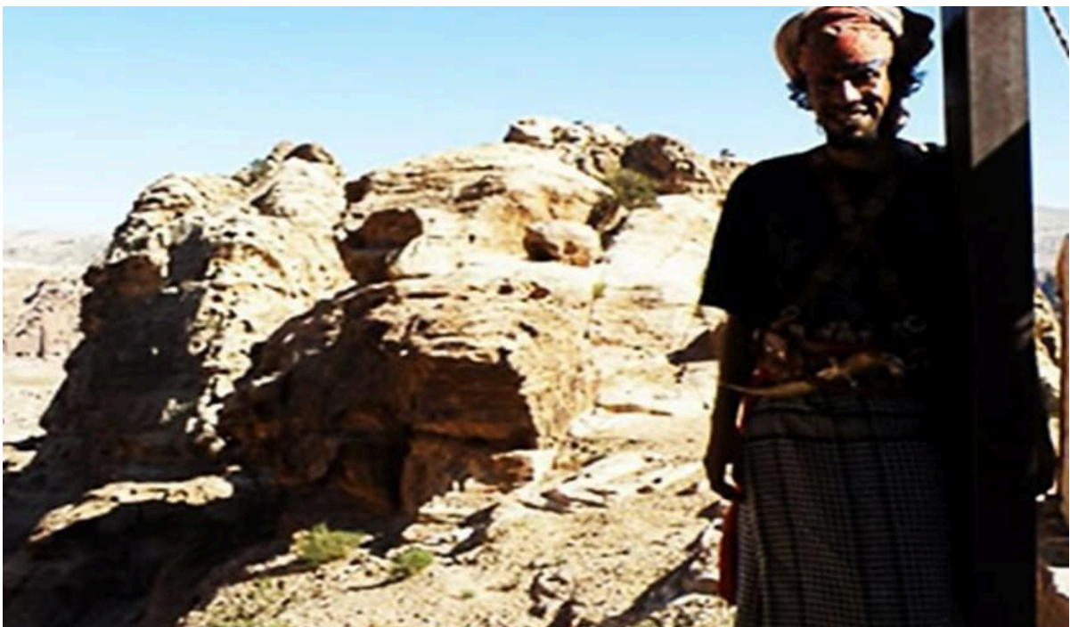
Imagem 2- Beduíno que encontrou os manuscritos do Mar Morto em 1947, Qumran