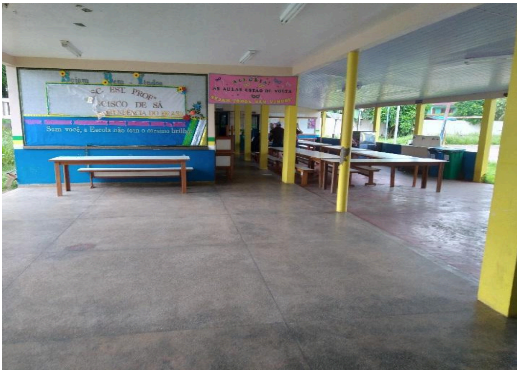
Imagem 3 – Refeitório