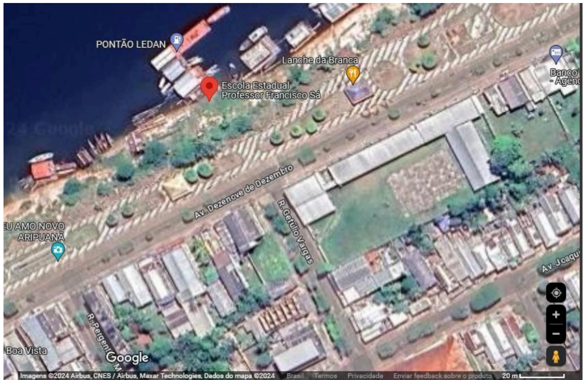
Imagem 5 – Visão aérea da escola