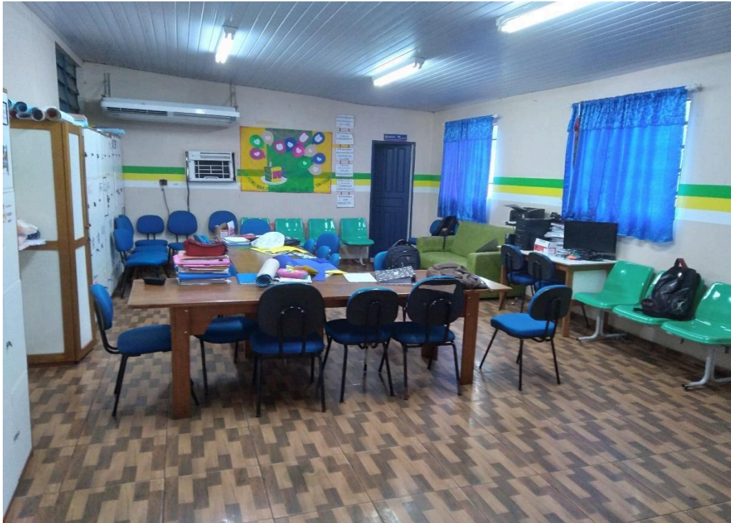
Imagem 4 – Sala dos professores