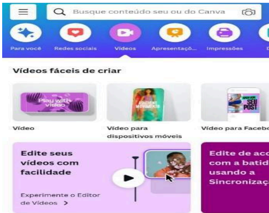
Figura 2 Área do aplicativo Canva