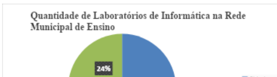
Grafico 1 Laboratórios de Informática na rede municipal de ensino.

De acordo com o grafico abaixo a rede municipal de ensino conta com um total de 96 escolas entre zona urbana e rural que possuem laboratórios em funcionamento, 49% dos Labins estão na cidade, 27% no planalto e 24% nos rios. Apesar de ser uma pequena quantidade de escolas com laboratórios de informática em funcionamento, mesmo contando com pouca estrutura em relação à quantidade de computadores e outros equipamentos necessários nos Labins, mas já é um grande avanço que vem sendo apoiado pelo Governo Municipal através da Secretaria Municipal de Educação e Desporto-SEMED, bem como pelo próprio NTM, que tem somado esforços e buscado parcerias para dar um melhor suporte e apoio às escolas, mesmo com uma equipe técnica reduzida, consegue fazer um trabalho de manutenção e apoio pedagógico visando um melhor funcionamento e desenvolvimento das atividades desenvolvidas nos Labins.