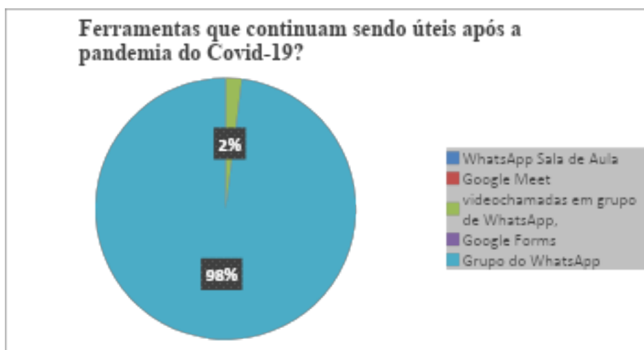
Grafico 4 Ferramentas utilizadas após a pandemia do Covid-19