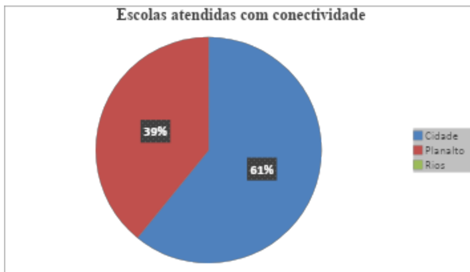
Gráfico 3 Escolas com conectividade.