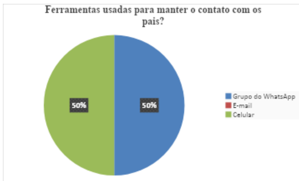
Grafico 5 Ferramentas usadas para manter o contato com os pais

Uma das estratégias utilizadas pelas escolas para o contato com os pais foi buscar apoio nas TICs e, para isso, utilizou-se o whatsapp . Tendo sido uma das atividades constantes, realizadas tanto pela escola quanto pelos professores para manter o diálogo com a família, pois além de aproximar a família da escola, cria-se uma parceria que trouxe benefícios tanto para o aprendizado dos alunos, quanto para fazer com que os pais tenham mais responsabilidade com a educação dos filhos. E, nesse sentido o uso de algumas ferramentas são importantes para fazer essa conexão entre pais e escola.